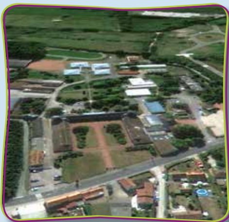
Site de l'ITEP

Situé sur la Côte d'Opale à 4 km de la mer, à proximité de Berck-sur-Mer, L'Internat et le Semi-Internat sont implantés à Rang-du-Fliers sur un site de 17 hectares leur permettant de proposer un éventail d'activités important sur un lieu de vie animé et chaleureux.